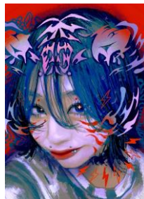
ビジュアル : AIKA BAMBAM (BAM SPAKLES)

2014年から日本語ラップダンスチーム 「ALLOY MANIA」で地元仙台を拠点に 活動し、若手の育成に尽力する。