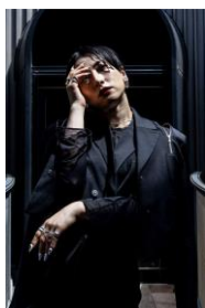
完成度 : MEDUSA (ebony)

日本を誇り、世界の様々な人々との触れ合いや文化を学びながら自然や気を感じたままに作品として形に残す。"愛と平和"をテーマにさまざまな視点で作品を作り続ける。