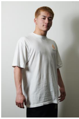
■BREAKING WINNER TOA (Body Carnival) 23歳／Hometown：京都 FINAL出場歴：初出場

京都府亀岡市出身。 13歳の頃に一撃のKATSUの元でブレイクダンスに出逢い、18歳でBody Carnivalに加入。圧倒的な速さとキレを武器に、フットワークとフローの中にパッションを組み合わせたスタイルが特徴的。 公益社団法人日本ダンススポーツ連盟(JDSF)の強化指定選手でもあり、所属するBody Carnivalだけでなく個人でも数々の功績を残し経験を積む注目Bboyの一人。