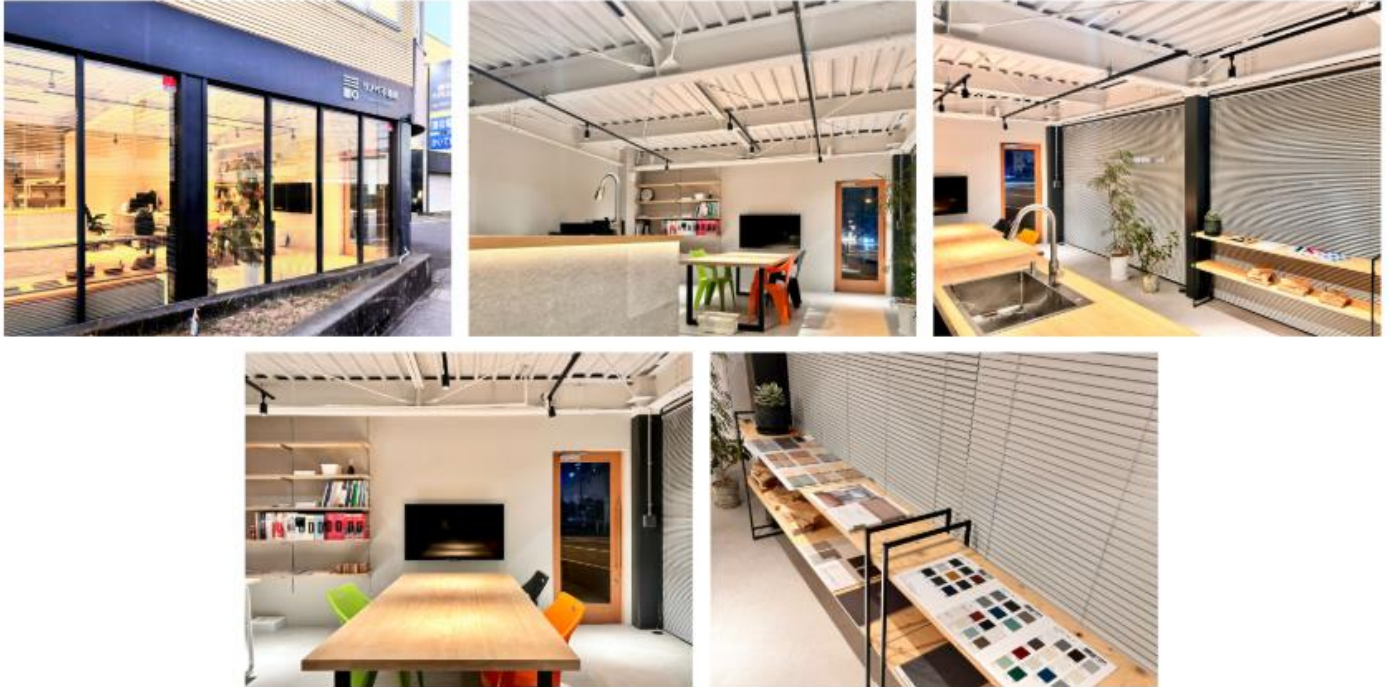
事例写真やサンプルを手に取りながらリノベーションを体感できるショールーム お住まい探してご不明点等ございましたら、お気軽にご相談くださいませ

今回新たに展開するリノベ不動産事業では、住まい探しからリノベーションの施工までを一貫してサポートし、お客様はもちろん、私たちもワクワクするご提案をまいります。