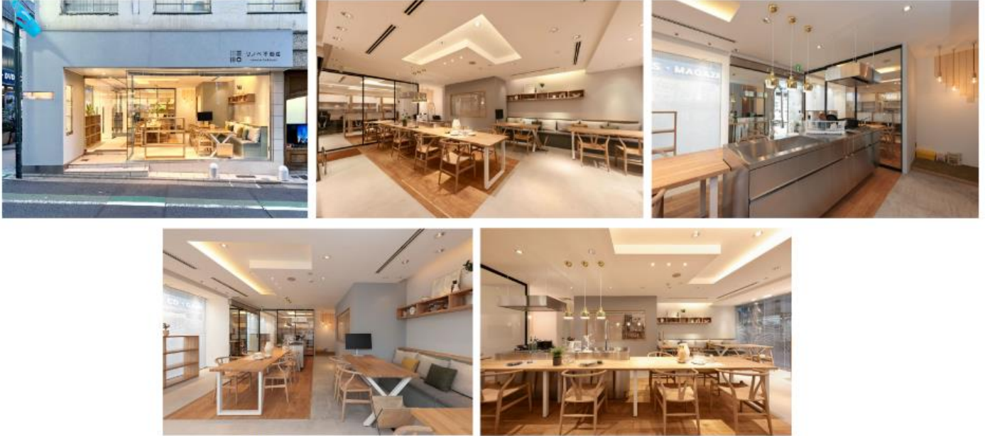
透明感あふれる広々とした空間と木の温もりに包まれた明るいショールーム お住まい探しでご不明点等ございましたら、お気軽にご相談くださいませ

今回新たに展開するリノベ不動産事業では、自由が丘を中心に、住まい探しからリノベーションデザイン、施工、ファイナンス、アフターサービスに至るまで、一貫したサポートを提供いたします。「中古住宅+リノベーション」というワクワクする新しい選択肢をお客様にご提案してまいります。ぜひ一度、ショールームへお越しください。