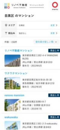
マンション一覧画面