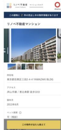
マンション詳細画面