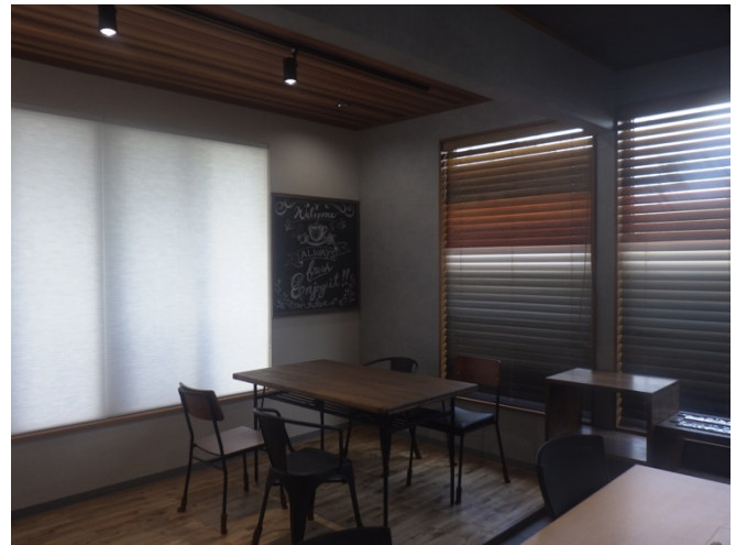
落ち着いたあるモノトーンな雰囲気のリノベーションショールーム

事例写真も多く飾っておりますので、リノベーション後の暮らしを想像しながらお打ち合わせが可能です。