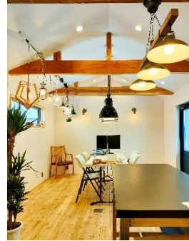
建材やライトなどこだわりの詰まった平屋のショールームは、天井高で開放のある空間となっています