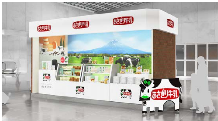
【あさぎり牛乳】公式 HP: https://www.asagiri-milk.jp/sweets/