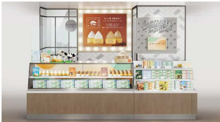
【朝霧高原菓子舗】公式 HP: https://asagiri-kashiho.jp/

株式会社たこ満（本社：静岡県菊川市、代表取締役：前堀誠）は、静岡発のエシカルスイーツブランド「朝霧高原菓子舗」「あさぎり牛乳」のポップアップショップをJR品川駅に期間限定初出店いたします。各ブランドから、品川駅初出店を記念してコーヒーの味わいをお楽しみいただけるスイーツ『生とろりチーズケーキ生富士山 コーヒークリーム』『リッチミルクサンド ミルクコーヒー』を期間限定で販売いたします。