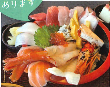
人気 No.1 海鮮玉手箱