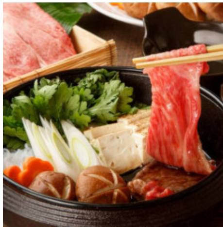
宮崎牛すき焼き用スライス