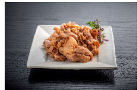
観音池ポーク焼くだけミート

宮崎ブランド豚「観音池ポーク」をばあちゃん本舗オリジナルのつけダレに漬けています。お肉がスライスされているので、炒めるだけの簡単アイテムです。黒ダレ・みそ仕立・生姜たれの3種セットです。