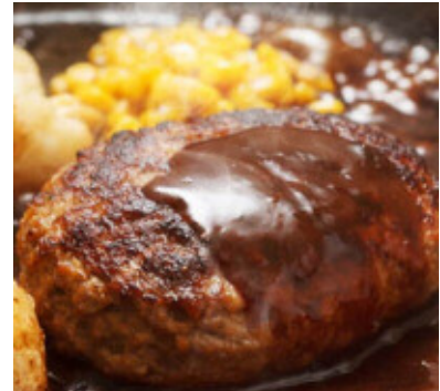
宮崎牛入りハンバーグ

宮崎牛（A4ランク以上）と宮崎県産豚との合挽ハンバーグです。焼くだけで簡単に、絶品ハンバーグを味わえます。