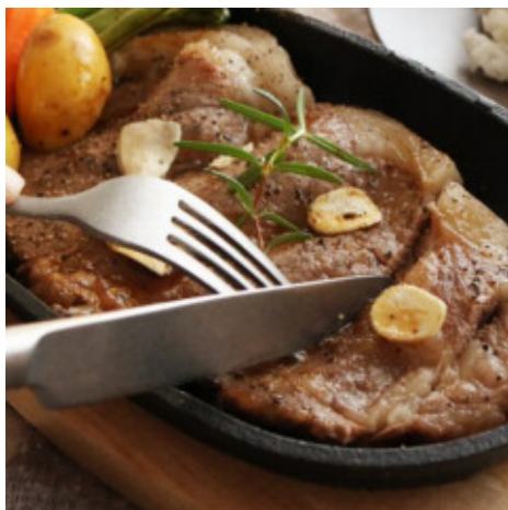
宮崎牛サーロインステーキ

JAFでは地域振興やドライブ観光促進の一環として、自治体の魅力を多くの方に知っていただけるようさまざまな取り組みを行っています。通販サイトである「e-JAF Shop」では、JAFと観光協定、会員優待施設契約を結んでいる全国の市町村や企業の魅力ある名産品、特産品を販売しています。今回販売契約を締結した、ばあちゃん本舗株式会社は「味の温故知新」、「宮崎のうまいものを創造する」をテーマに、宮崎県産食肉を主原料とした安心安全で、おいしく、心躍るユニークな商品を販売している会社です。「e-JAF Shop」で販売を開始した6商品も、「宮崎牛サーロインステーキ」をはじめとした、宮崎の上質で美味しいお肉を味わうことのできるものとなっています。なお、「e-JAF Shop」はJAF会員だけでなく、一般の方も利用することができます。また、JAF会員価格でも販売しております。お取り寄せグルメで楽しいおうち時間を過ごしてみたいはいかがでしょうか。