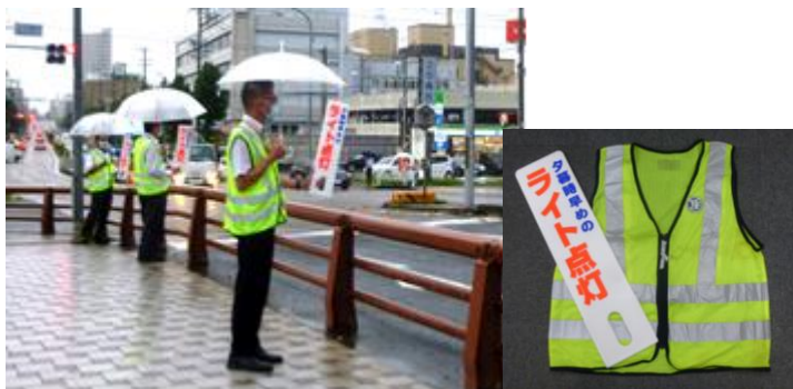
反射材ベストを着用し、交通安全の啓発をします（イメージ）