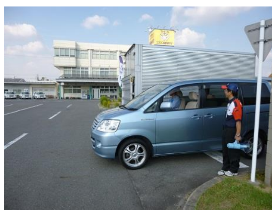
見通しの悪い交差点の通過