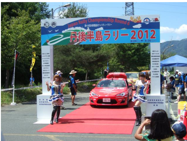
セレモニアルスタート イメージ

なお、市役所前駐車場はサービスパークとなります。サービスパークとは林道SS（スペシャルステージ）を終えた競技車が整備をする場所で、一般の方も間近で見ることが可能です。