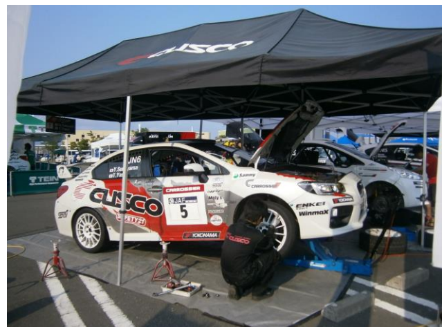
サービスパーク イメージ