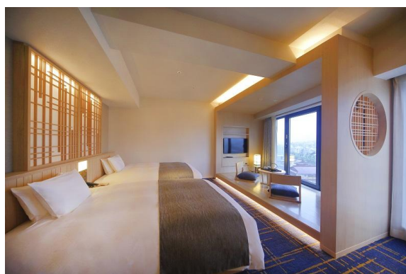
リバーサイドデラックスツイン