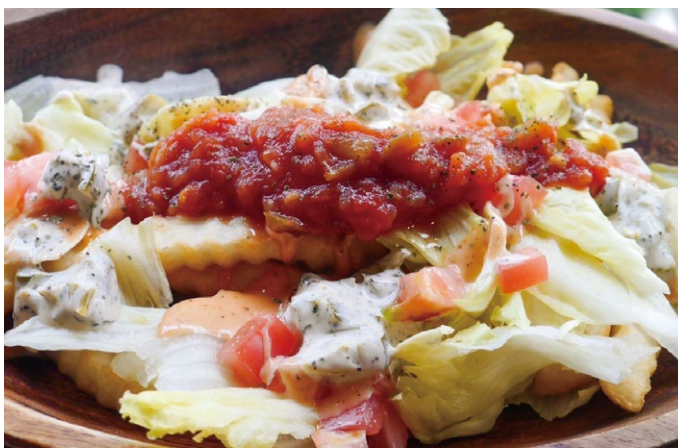
●ピリ辛メキシカンサルサポテト ¥1,000