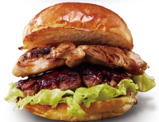
●てりやきチキンコンボバーガー ¥1,750