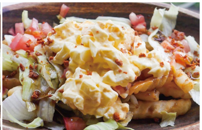
●たまごタルタルのテリヤキポテト ¥1,000