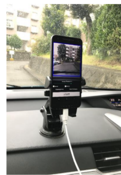
スマートフォン設置例