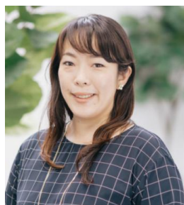
『ケイコとマナブ』プロデューサー：廣田知子

習わせたいおけいこの1位は、多くのママたちが経験のあるスイミングでした。自分が経験したということも大きな理由の一つだと考えられますが、ママたちが子供のころに比べ、ベビースイミングなどの講座を持つスクールも増えており、赤ちゃんから習えるイメージが十分に定着している結果だと思います。また、マタニティスイミングからベビースイミングへ移行する方も多く、スクール側から見れば、早期囲い込みがうまくいっているとも言えます。