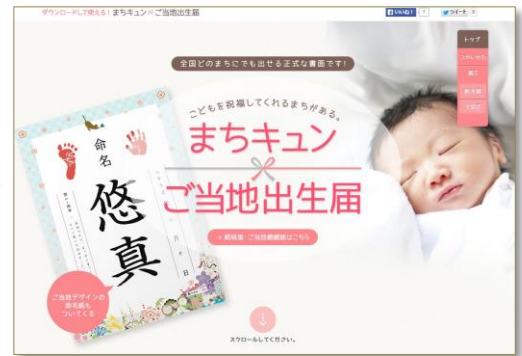
▲まちキュン・ご当地出生届WEBページ

「バタバタしていて、命名式は特にしなかった」との声も多く、これを機会に子どもが生まれた喜びを形に残し、楽しい思い出にできればと願いを込めて「命名紙」もご用意しています。