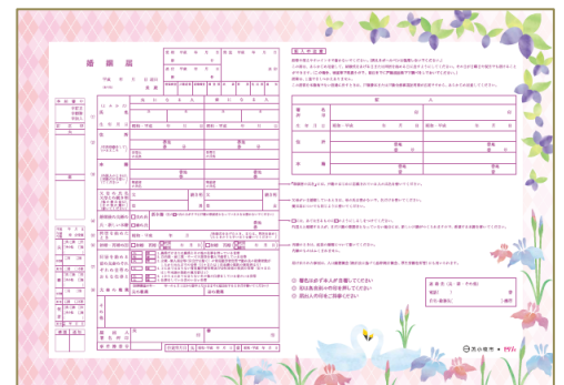
▲苫小牧市のまちキュン・ご当地婚姻届

【これまでの参画自治体】愛知県、石川県、出雲市、伊勢市、牛久市、浦安市、大分県、大津市、加東市、加賀市、上市市、京都府、熊本県、郡山市、神戸市、寒河江市、静岡市、高石市、つくば市、栃木県、鳥取県、奈良県、日光市、蕪崎市、広島県、福井県、福岡市、文京区、松浦市、山口県、山口市、湯沢市と、羽生市、今回の苫小牧市で全34自治体となります。