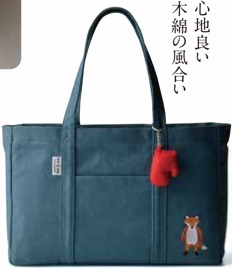
◎子ぎつねイラスト=絵本作家 菅野由貴子氏

トートバッグ(縦24×横35×マチ7.5cm、帆布綿、ブルー)税込 7,480円 手袋キーホルダー(ポリエステル65%、綿35%、レッドイェローブルー)税込 990円 ■【本館】4階婦人服特設会場