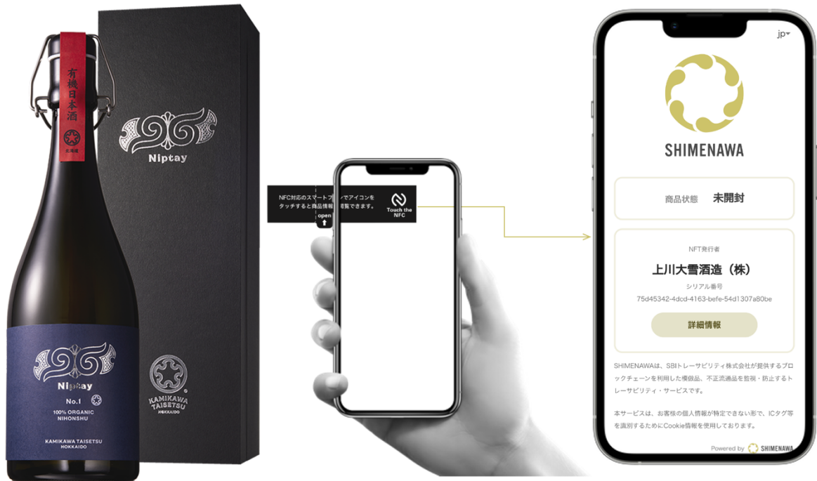
上川大雪酒造・新商品「Niptay No.1 100% ORGANIC NIHONSHU」 ブロックチェーン技術で保護された情報で未開封の正規品を証明

上川大雪酒造は当社提携先の株式会社仙台銀行（本店：宮城県仙台市、頭取：鈴木 隆）により取引先企業の本業支援一環として当社「SHIMENAWA（しめなわ）」が紹介されたものです。