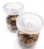
クラフト用ボタンピース φ7~15mm ランダム150個 ピンなし 2,160ポイント