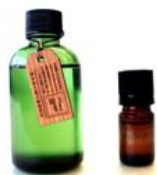
小国杉和精油 葉：10ml (写真右) 3,600ポイント