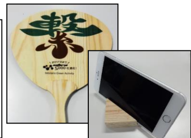
▲企業ノベルティの一例 (うちわ・モバイルスタンド)