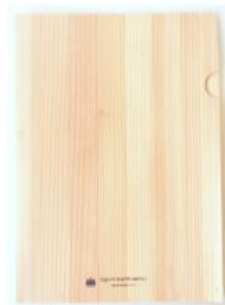
A4ファイル：400ポイント