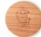
コースター：150ポイント