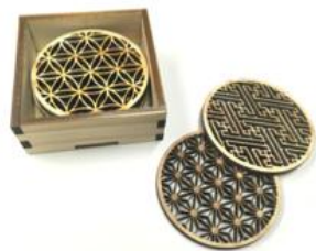
コースター (木箱入り) φ80×厚4mm 6枚セット 4,500ポイント