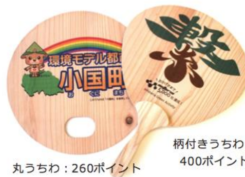
丸うちわ：260ポイント