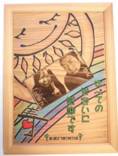
メモリアルボード デザイン持込 ・A4カラー：8,640ポイント ・A3カラー：10,800ポイント