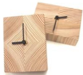
置時計【baumkuchen】 120×90×35mm (数量限定品) 3,800ポイント