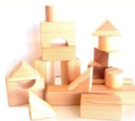
つみきセット (木箱入り) 外箱285×385×80mm 18ピース 8,640ポイント

注文を頂いてからひとつひとつ作り上げますので、お届けまでひと月前後お待ち頂くことがあります。楽しみにお待ちください。