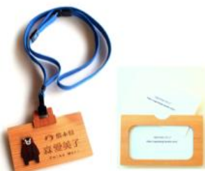
ネームプレート デザイン持込 背面カードポケット付き ストラップなし 60×100×3mm：2,160ポイント