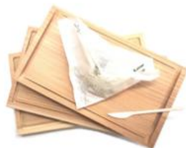
カッティングプレート【bordish】 175×280×18mm 1枚 3,800ポイント