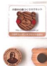
マグネット/ピンバッジ/ストラップ・キーホルダー (台紙込)：500ポイント