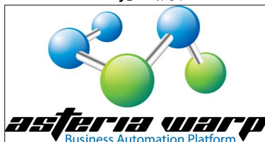
ASTERIA シリーズの主力製品 「ASTERIA WARP (アステリア ワープ)」

ASTERIA は 2002 年に販売を開始したデータ連携ミドルウェアで、インフォテリアの主力製品です。販売開始以降、順調に販売を拡大し 2015 年 5 月末の導入社数は 5,020 社となり導入社数が 5,000 社を突破しました。この要因は、ノン・プログラミングによる使いやすさなど、製品力によるユーザーへの貢献に加え、ASTERIA パートナー各社と強固なパートナーシップを築き、メーカー、パートナー、ユーザー 3 者の「共存“協”榮」を実現することができたことによると考えています。