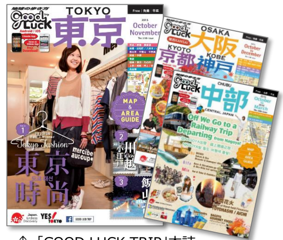
↑ 「GOOD LUCK TRIP」本誌 (2015年度は、国内10エリアで展開中)

← 「GOOD LUCK TRIP JAPAN App」 (言語設定：中国語簡体字)